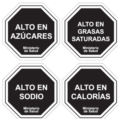
Diagrama N° 1

Las características gráficas de los descriptores nutricionales señalados en el Diagrama N°1