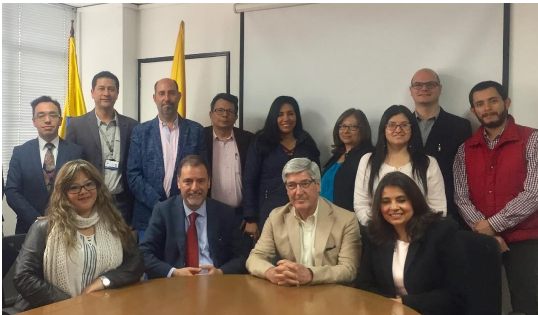
Delegación de la Facultad de Ciencias Químicas y Farmacéuticas de visita en la Pontificia Universidad Javeriana de Colombia, durante su gira de difusión internacional.